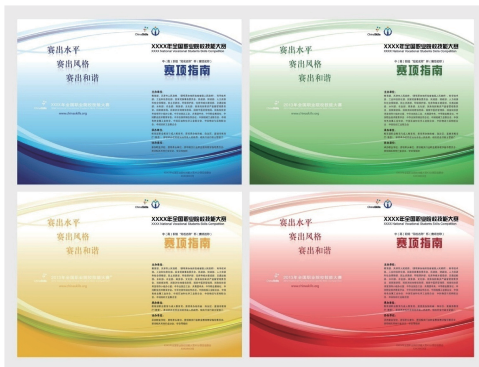
图5 赛项指南封面与封底方案